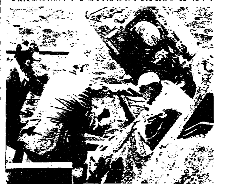
تاتد المركبة «ايول» نوميستونورد لدى خروجه من العربة بمساعدة اثنين من الالياه

ويوقع ان يتضاعف هذا العدد حتى نهاية تموز. وتنتظر اصحابات خاصة، ان اكثر من ٤٥ ألف عراقي دخلوا بريطانيا هذا الصيف، مقابل ثلاثة الاف في الصيف الماضي، وان عدد العراقيين الذين منحوا تأشيرات دخول من السفارة التركية زاد على اثنين الف عراقي، بما دفع السفارة التركية في بغداد الى تعليق منح التأشيرات للدول لمدة اسبوعين بسبب الفيضانات التي تعطلت المدن التركية من كركوك العراقية. والمفروض ان الفيضانات القوية العراقية اوقفت رحلاتها الى بيروت بعد وقوع الاحداث الاخيرة باستثناء رحلة واحدة في الاسبوع، ثم زادت الى رحلتين اخرى. اما طران الشرق الاوسط فظلت تحت رحلتها اسبوعياً، الا انها واجهت زخماً كبيراً من المسافرين العراقيين خلال الاسبوعين الماضيين. وتتبع الاحصاءات الى ان معدل سفر العراقيين الى لبنان خلال حزيران وتوزع من العام الماضي زاد عن ١٠٠ ألف عراقي، في حين لا يزيد عددهم هذا الصيف على التي عراقي.